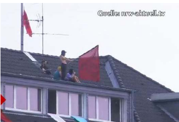
Aktivisten belagern Haus in Essen