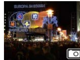
ESSENER CITY Lichtwochen und verkaufsoffener Sonntag