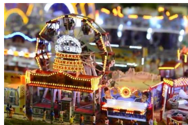
Miniaturwelt in Essen