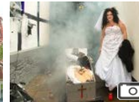
KÜRBISFEST Gruseliges Kettwig