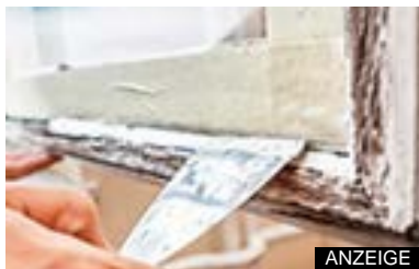
Geld zum Fenster hinein!