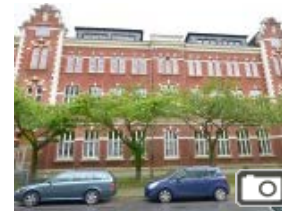
100 ORTE (99) Eltingerviertel im Essener Nordviertel